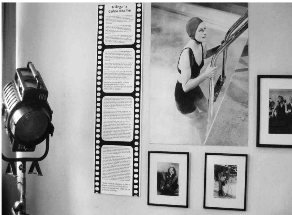
Bilder i Muséet från Greta Garbos sista film "Tvillingarna"

På styrelsemötet förra veckan beslutades att Årsmötet skall hållas 23 oktober kl. 13.00 på Garbomuseet i Högsby.